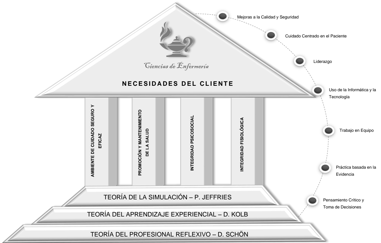
Figura 2. Modelo Conceptual Curricular - Programa de Enfermería